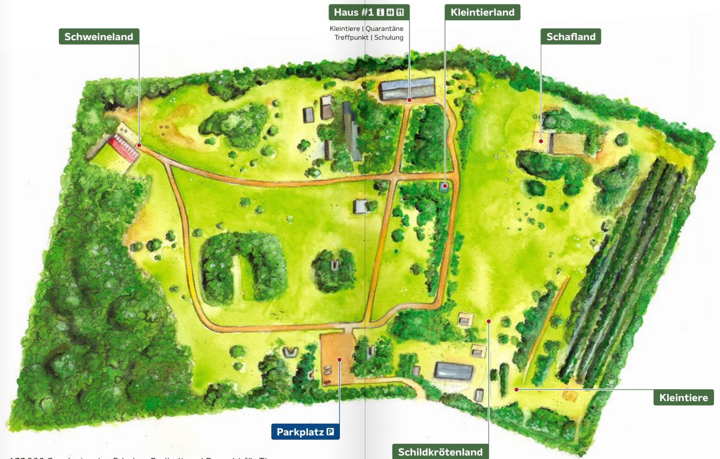
133000 Quadratmeter Frieden, Freiheit und Respekt für Tiere.

Lust, dabei zu sein? land-der-tiere.de/mithelfen